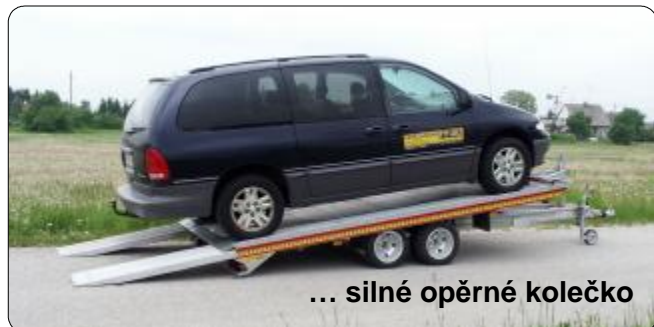
... silné opěrné kolečko

Přívěs se velmi snadno překlápí přes těžiště také díky tlumičům. Naložení a složení vozidla je možné také bez tažného vozidla!