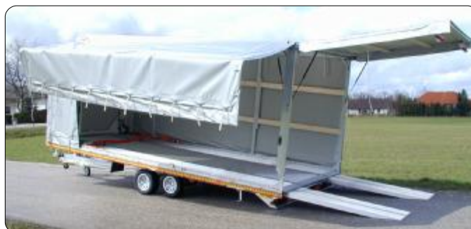
ALU plachtová konstrukce – plachtu lze srolovat. Materiál v té nejvyšší kvalitě

Přívěs se velmi snadno překlápí přes těžiště také díky tlumičům. Naložení a složení vozidla je možné také bez tažného vozidla!